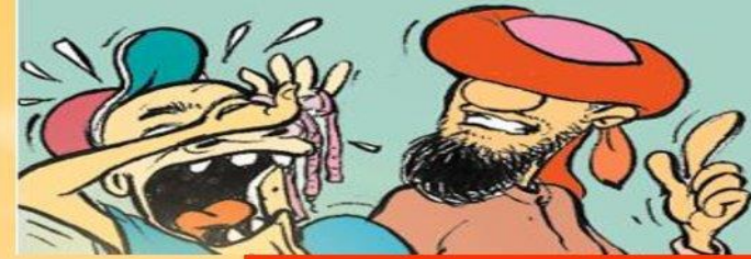
Cabaran rakan sebaya